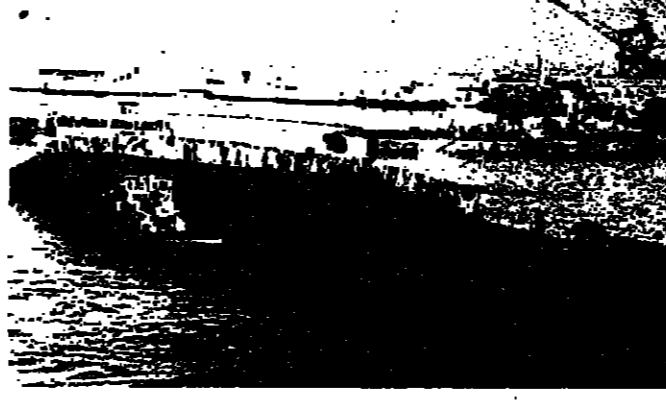
غواصة فرنسية مجهزة بصاروخ م ٤

تبدو التقارير متشابهة الى حد الكف بان عقلا واحدا كان وراء اعدادها ، فهي تركز على نقطة معينة ، لعل اهمها هي رفع الجزاينة العسكرية من ٢ الى ٤ ، بالذات بالنسبة للدخل القومي العام وهكذا فان هذه الجزاينة التي بلغت في العام الجاري ٨٠ مليار فرنك يجب ان تصبح ١٠٠ مليار فرنك حتى تمديد الاستثمار «الوطني» الى الفرنسيين ، والتقارير لا تخطف في اتجاهاتها عن السياسة الجيسكرية التي تقوم على الالئك المتواصل للسلحة المتقدمة .